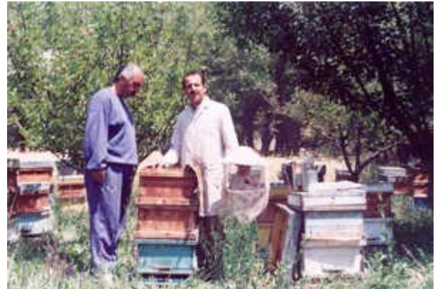
Forfatteren i sin bigård

Det iranske landbrugsministerium afprøvede midler mod varroa fra