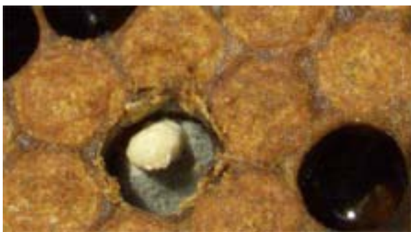
Vi fandt også kalkyngel, men det er ikke så alvorligt som ondartet bipest.