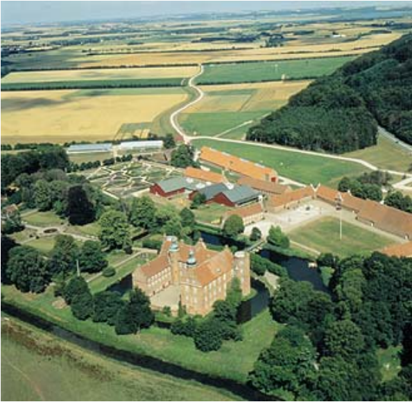
Herregård og landbrugsmuseum Gl.Estrup