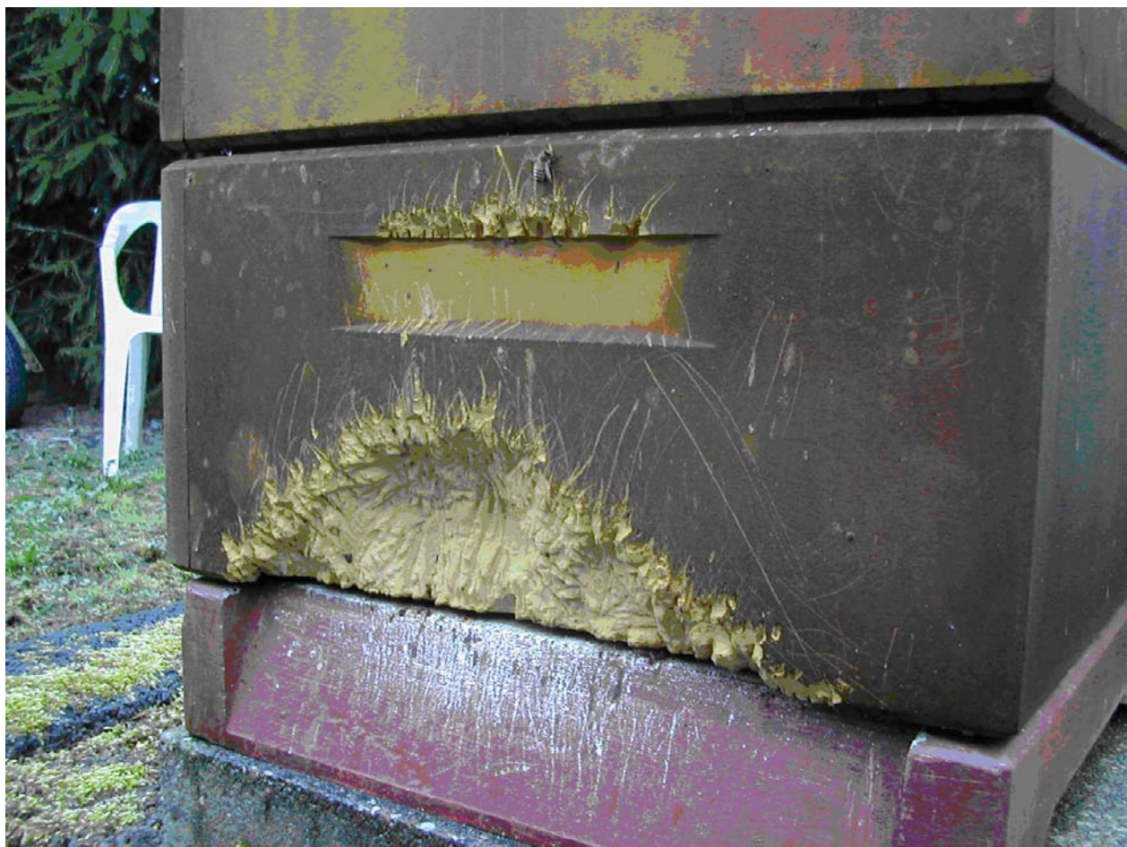
Grævlingen kan også lide honning