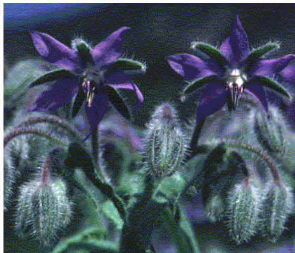
Hjulkrone er en god biplante

Der var meget lydhørhed overfor at tilså brakarealer og ukurante hjørner med biplanter. De fleste landbrugere så hellere en blomstrende mark end en brak med kedeligt græs, så hvad skal vi så, som en planteavler spurgte.