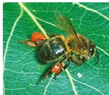
Bier med propolis